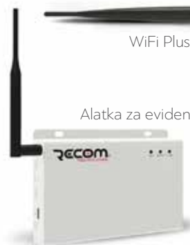
Alatka za evidenciju