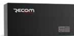
Alatka za evidenciju-Z