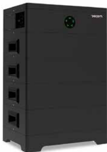
ΜΠΑΤΑΡΙΑ ΑΠΟΘΗΚΕΥΣΗΣ ΕΝΕΡΓΕΙΑΣ